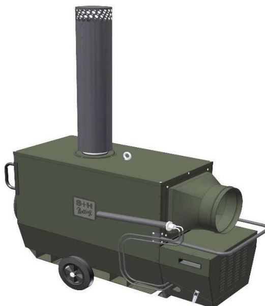
Defender 40 in RAL 6006 grau-olive