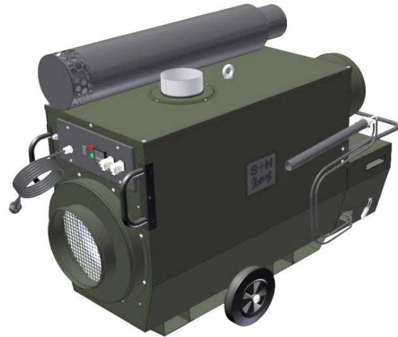
Radialventilator / Umluftstutzen / Brennerhaube

HLF mit Radialventilator für hohe Luftleistung und Pressung RAL 6006 grau olive