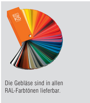
Die Gebläse sind in allen RAL-Farbtönen lieferbar.