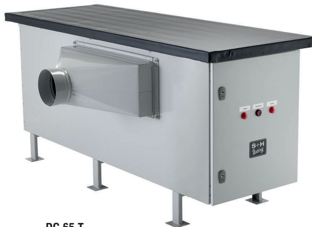
DG 65 T

Weltweite Referenzen „With air made by Nolting“: www.gustav-nolting-gmbh.de (-> unternehmen -> referenzen -> druckhaltegeblaese)